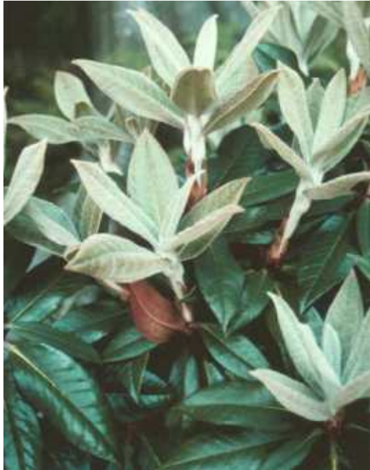
R.bureavii m/ nyvekst.