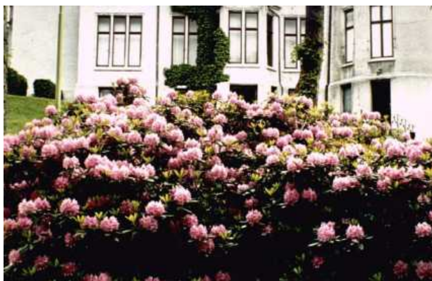
R.catawbiense på Gamlehaugen. Foto: Reidar Kvam, 1978.

Da jeg kom til Bergen i 1960, og så rhododendronblomstringen den våren, tapte jeg mitt hjerte til R.catawbiense . På tross av alle de nye som er kommet til etter hvert, er jeg blitt trofast overfor catawbiense. Den største opplevelsen har jeg når den blomstrer sammen med - og samtidig med - gullregn. En slik kombinasjon finnes på Møllendal kirkegård, hvor det forøvrig er flotte partier med store, kraftige rhododendron.