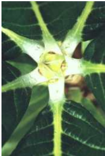
2.premie: R.sinogrande . Knopp og blad.

Styret takker for alle innsendte bidrag til konkurransen. Flere bilder vil etter hvert bli benyttet i fremtidige nummer av "Lapprosen".