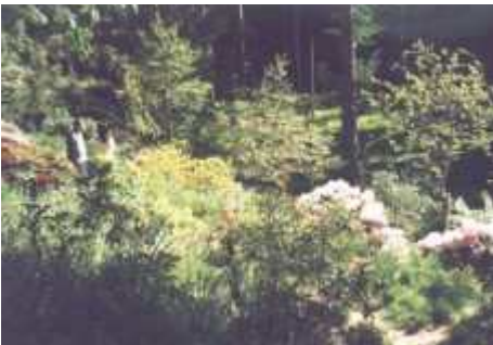
I mai 1999