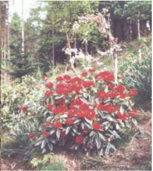
Rhododendron og Prydkirsebær (mai 1999)