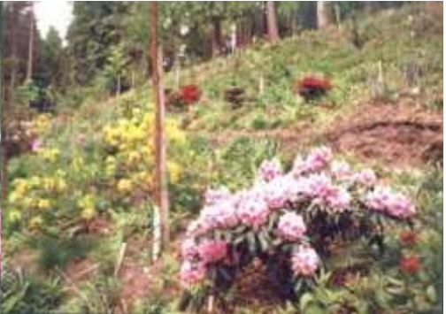
Mot øst (1998)