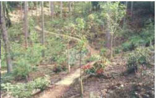
Mot vest (1997)