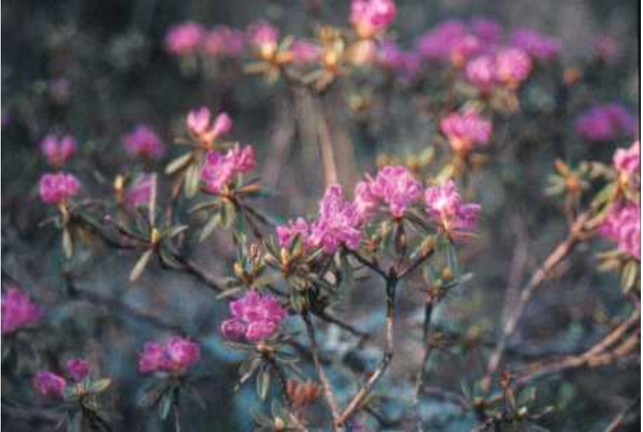
Trout River-typen av R.lapponicum slik den så ut i Sissel Lerums forsøksbeplantning på Milde.