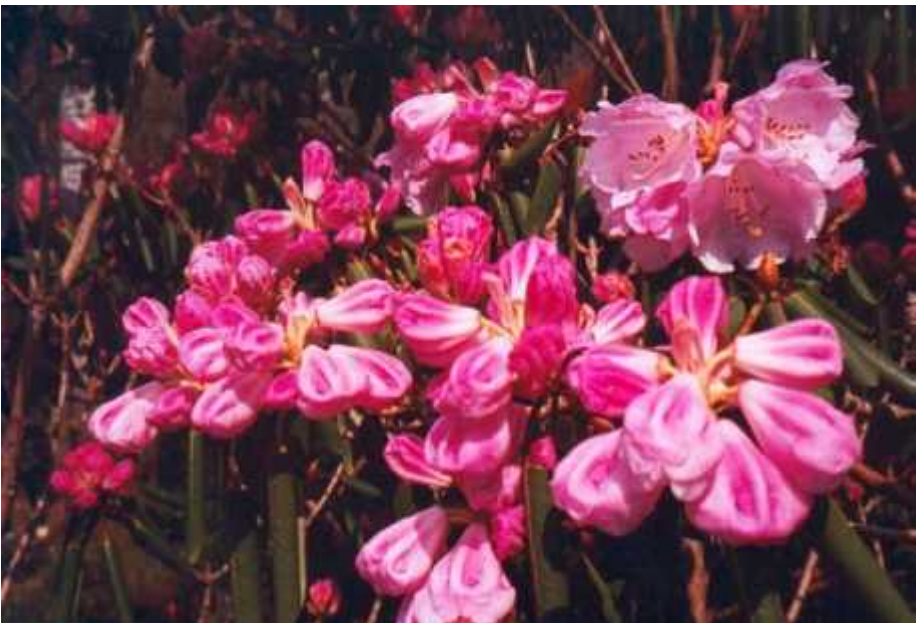
R.oreodoxa var. fargesii .