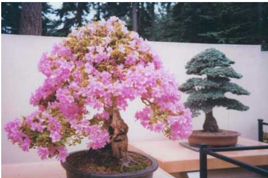
En gammel azalea-bonsai på utstilling i RSBG, juli 2000.