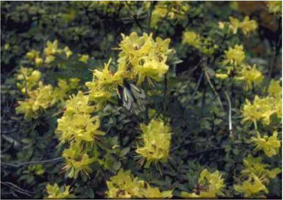
R.chryseum ved landsbyen Yongzhi, vest for Mekongelven, mai 1997.