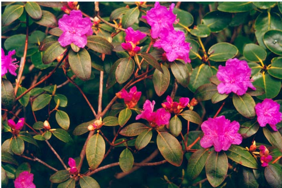
Rhododendron ledebourii.