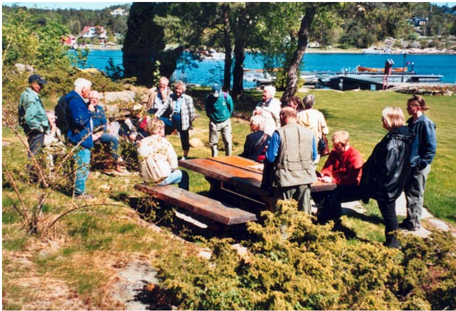
Fra Risholmen.