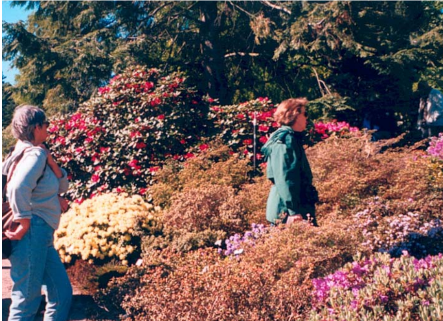
Fra Gøteborg Botaniske hage.