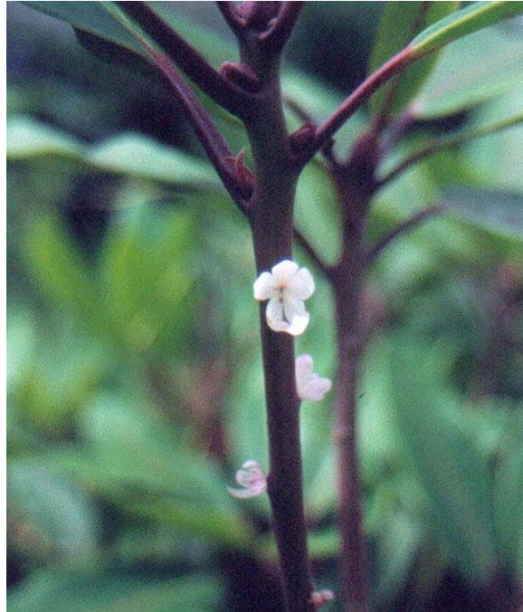
Nyvekst på 'Loderi King George' fotografert på Minde juli 2001.