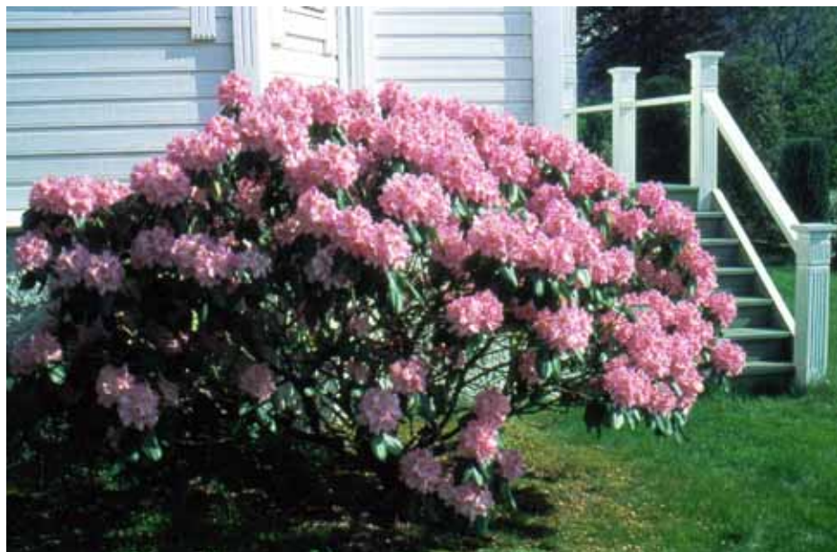
R. 'Scintillation' på Minde våren 2002