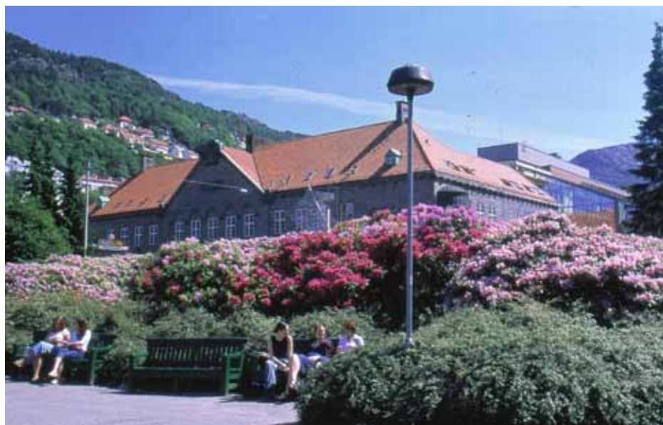
Hovedbiblioteket i Bergen, hvor vår samling av rhododendronlitteratur befinner seg.