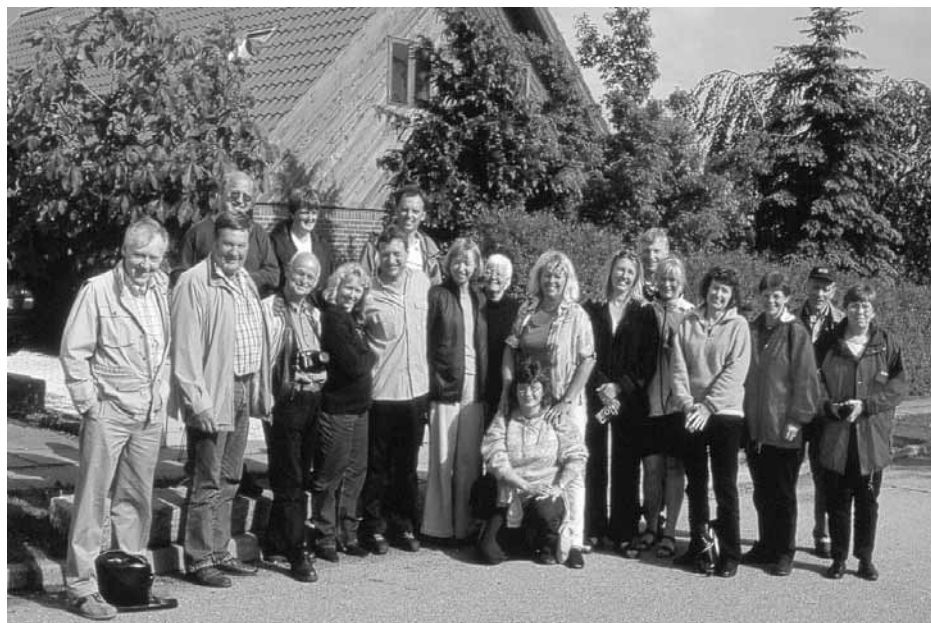
Det er godt å være rhodoman i Danmark!