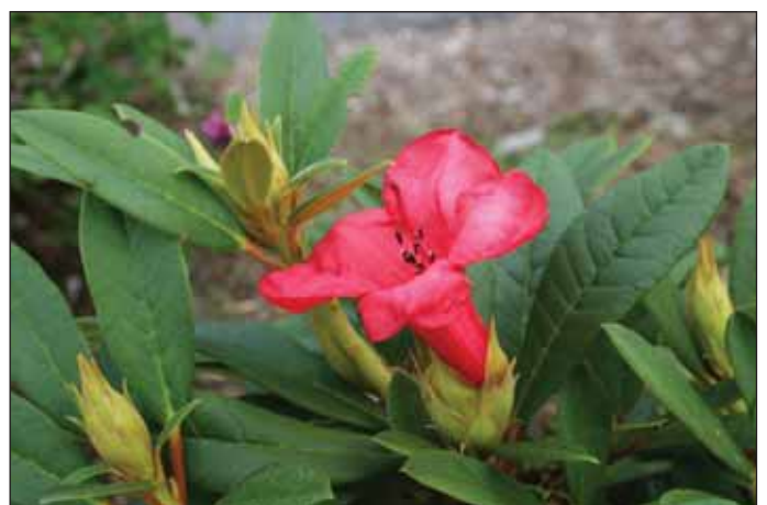
Fig.9: Rh. 'Elizabeth' , 8. september 2008.