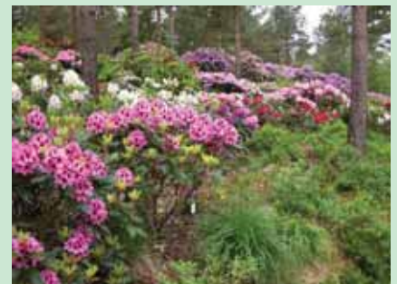
Rhododendrondalen Rogaland Arboret.