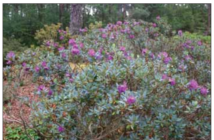
Fig.10: Rh. calostrotum ssp. riparioides Rock's form, 2. august 2006.