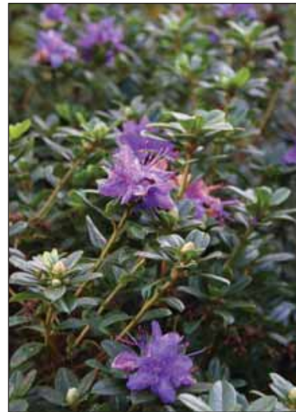
Fig. 14: Rh. 'Songbird', 24. sept. 2009.

Men en av de flotteste og sikreste høstblomstrene finner vi blant de lave lepidote artene, Rh. calostrotum var riparioides der det bare er den spesielle, mørkblomstrete Rock's form av denne arten (fig.10) som blomstrer regelmessig to ganger om året, men der er også flere av dens nærmeste slektninger som også oppfører seg slik, for eksempel Rh. saluenense var. chamaeunum (fig.11).