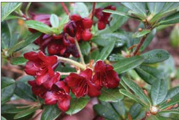
Fig.6: Rh. sanguineum var. didymum , 7. august 2009.