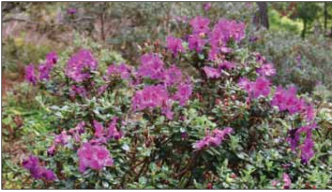
Fig.11: Rh. saluenense var chamaeunum , 18. august 2010.