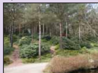
Parti fra Rogaland Arboret