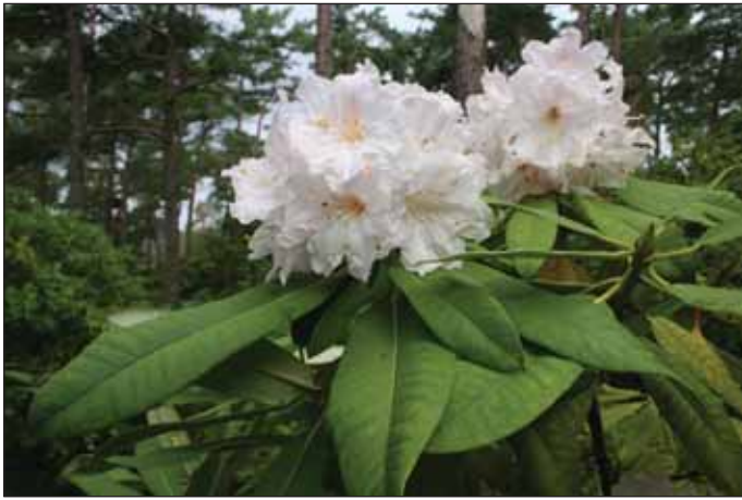
Fig.3: Rh. glanduliferum ., 23.juli 2009.