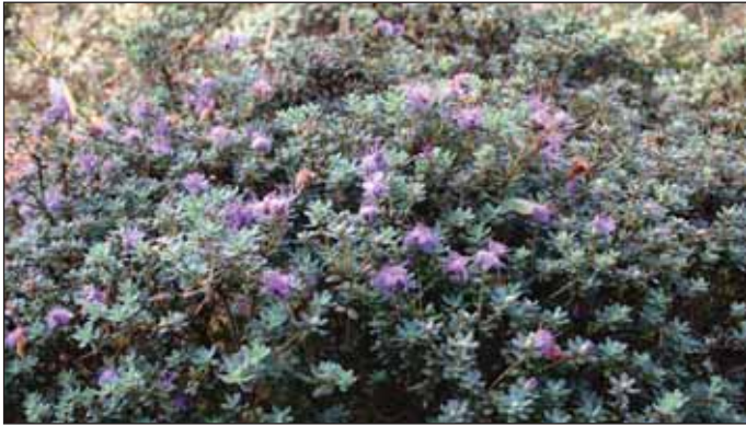
Fig.12: Rh. fastigiatum 'Blue Steel', 2. oktober 2009.

liten vits med større hardførhet. En av de beste skal være den amerikanske 'Summer Snow' (fig.5), en Leach-hybrid der Rh. maximum inngår. Denne har vi skaffet og plantet side om side med 'Polar Bear' på Milde. Hittil har vi ikke merket noen større forskjell på dem, bortsett fra at den amerikanske sorten blomstrer litt tidligere og ikke har like flotte blomster som den engelske. Dessuten virker veksten mer ulenkelig med lange skudd som gir planten et skranglete inntrykk, og som dannes før blomstringen, noe som skjuler blomstene. Konklusjonen er dessverre at man hittil ikke har fått til en sort som er åpenbart bedre enn moren for våre nokså milde forhold.