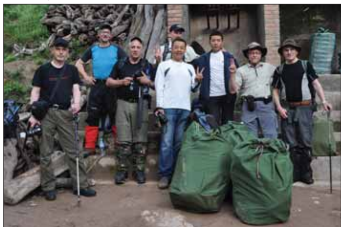
Deltakere + det kinesiske vertskapet vårt.