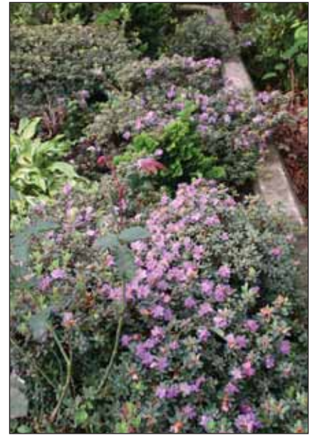
Fig. 13: Rh. 'Ramapo', 13. september 2009.

Det er fra denne subseksjonen alle de lave rød-blomstrete Hobbie-hybridene som er blitt så populære stammer, nemlig fra Rh. forestii var. repens . Flere av disse kommer gjerne i blomst av og til om høsten. Mest regelmessig er den forbausende lite kjente 'Abendrot' (fig.8), som er en søsterklon av den velkjente 'Elisabeth Hobbie' som ikke viser denne tendensen så tydelig. Også den langt mer følsomme, engelske 'Elizabeth' (fig.9), som er en krysning med Rh. griersonianum , viser gjerne noen blomster om høsten, liksom barna 'Better Half', 'Flaming Gold' og 'Whispering Rose'.