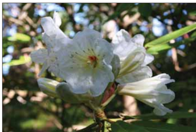
Fig.2: Rh. auriculatum , 23. juli 2010.

Men vi har en del arter og noen kultivarer som normalt blomstrer om høsten. Det er disse som vil bli omtalt her, og det er nødvendig å begrense seg til de mest trofaste: