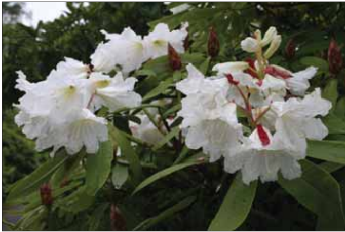
Fig.4: Rh. 'Polar Bear' , 23.juli 2009.