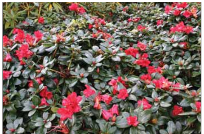
Fig.8: Rh. 'Abendrot' , 24. september 2009.