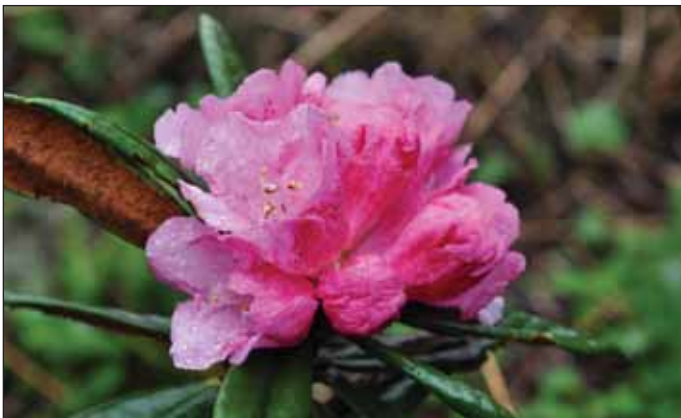
R. roxieanum , deep pink form.

Om kveldene når vi slappet av i spiseteltet, gjennomgikk vi dagens observasjoner. For meg var dette lærerike stunder, da jeg fikk ta del i all den erfaring mitt reise-