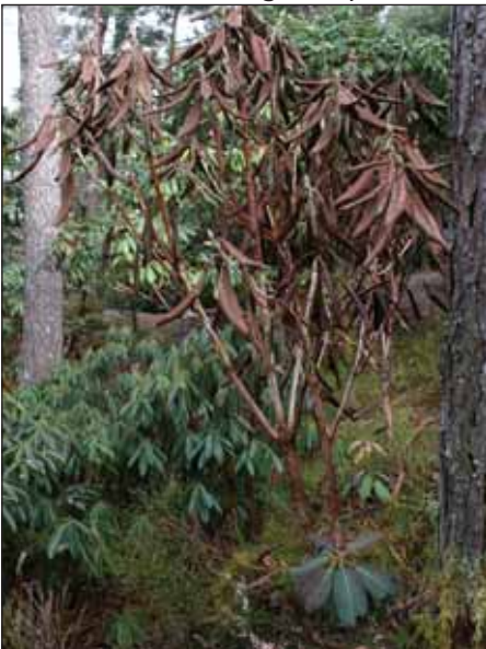
Rh. serotinum 16.04.2010

Rhododendron tåler som regel vinteren godt. De opprinnelige artene vokser mange steder høyt til fjells og er gjerne værutsatte. De ulike arter og sorter vil trives bra, eller mindre godt, på de ulike steder i landet.