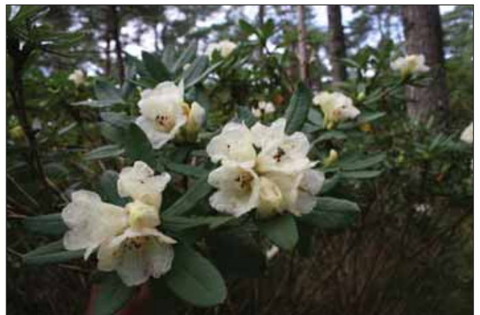
Fig.7: Rh. temenium var. gilvum , 18. august 2010.