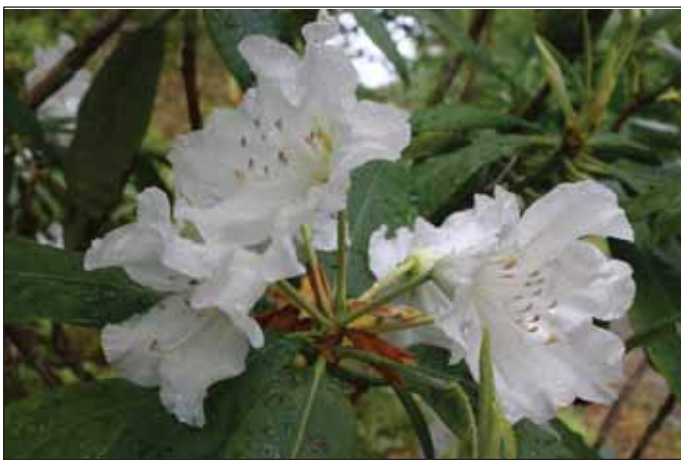
Fig.5: Rh. 'Summer Snow' , 7. juli 2009.