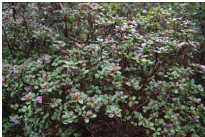
Fig.1: Rh. dauricum , 16. januar 2007.

Tekst: Per M. Jørgensen.